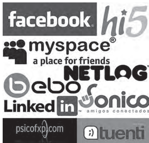
Figura 3 Redes Sociales Virtuales bajo el dominio de las Empresas tecnoinformáticas del capital