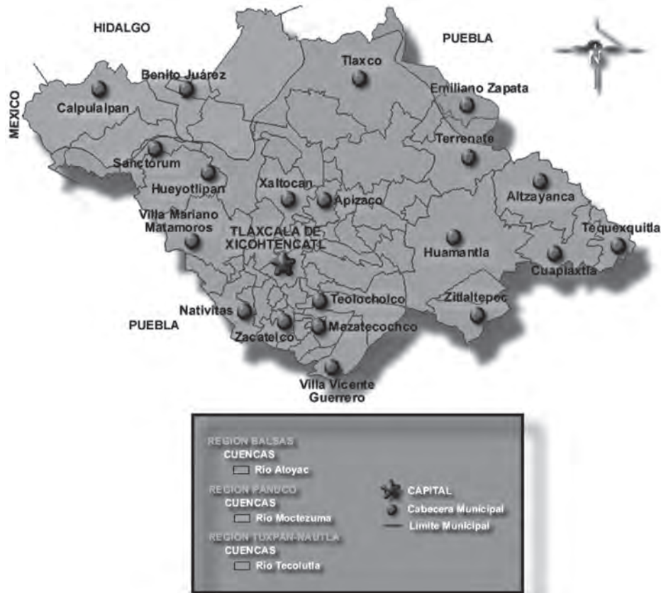
Figura 1 Mapa de localización del municipio de Tlaxco y municipios que integran su área de estudio en la región como Apizaco y Tlaxcala, México

Fuente: Cuenca Río Atoyac (18 A) y el río Zahuapan (18 AI). Este último río es la principal corriente de Tlaxcala. (México > Información Geográfica > Mapa con Regiones Hidrológicas)