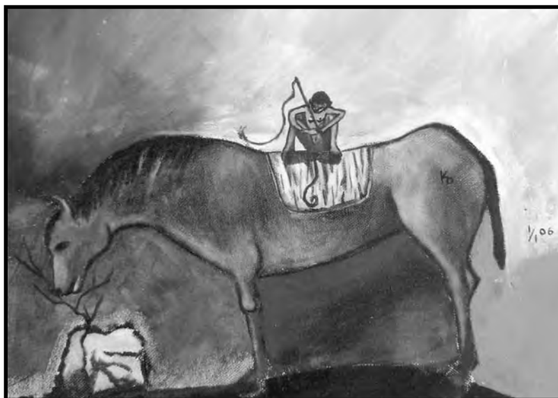
Monje loco, óleo y tela, 25 X 35 cm, 2006.