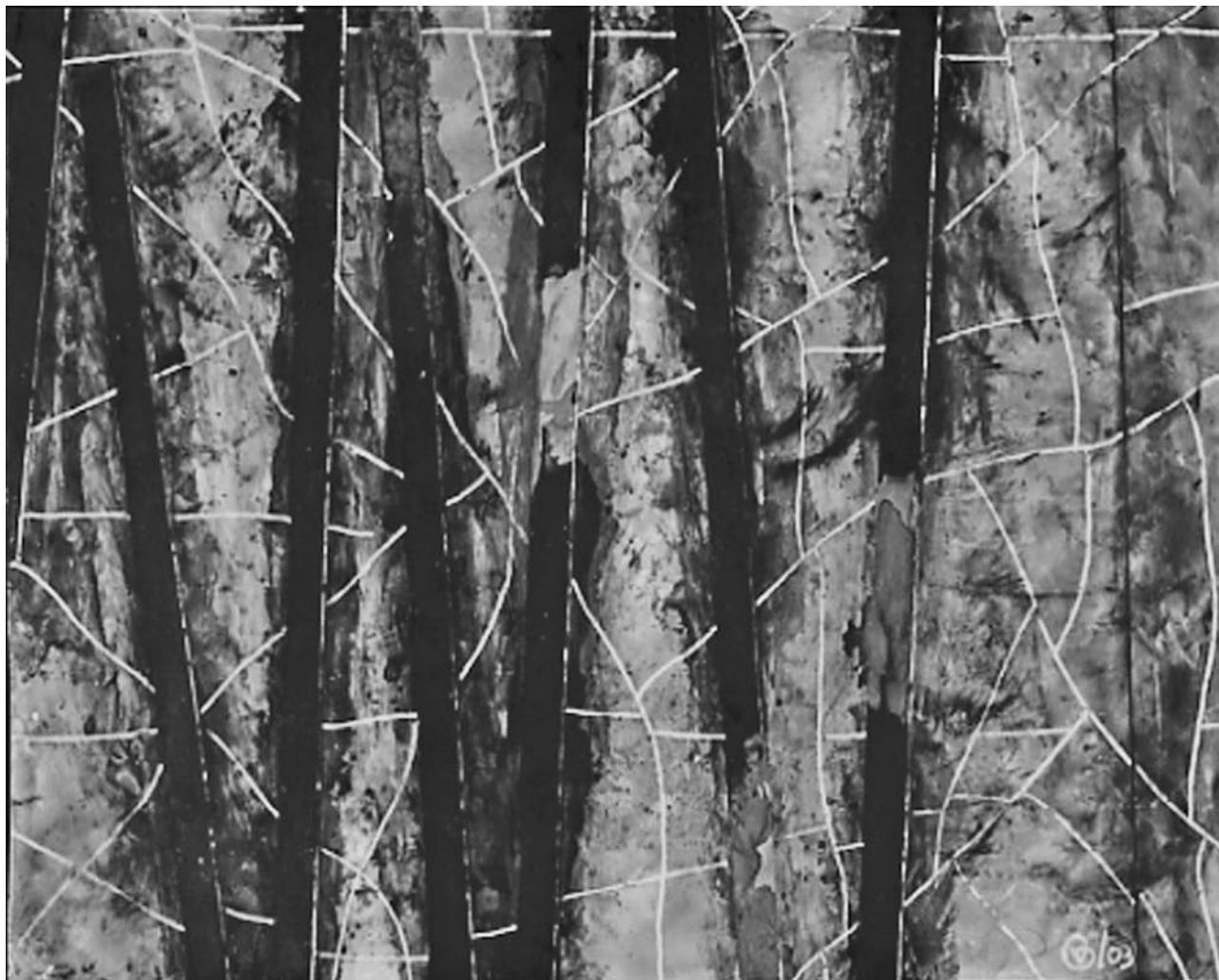
Líneas quietas, encaústica sobre papel, 45 X 55 cm, 2003.

de la primer gran crisis económica de alcance planetario y la de mayor prolongación en la historia contemporánea. Más aún, al transitar con la vuelta de siglo a un nuevo periodo de auge en el ciclo económico de la acumulación capitalista, lejos de traer consigo la globalización de la riqueza, lo que ha creado es la mundialización de la pobreza . Desbordando el carácter geohistóricamente circunscrito que tuvo la sobre-explotación de la fuerza laboral en sus periodos previos —el de sobre-explotación concentrada en la metrópoli (1740-1880) y de sobre-explotación concentrada en la periferia (1880-1970/80)—, la combinación de la actual revolución tecnológica con la derrota de los monopolios defensivos del ex-segundo y del ex-tercer mundos y la reconfiguración neoliberal del Estado ha fundado, por primera vez en la historia de la modernidad, la mundialización de la sobre-explotación laboral . Este proceso se ha agudizado en la periferia, pero también en