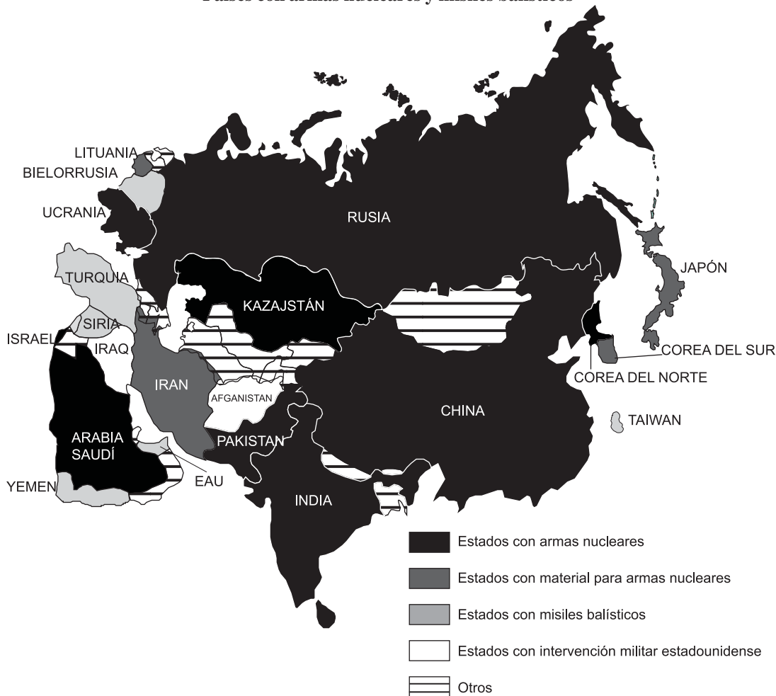
Países con armas nucleares y misiles balísticos

A través de una campaña propagandística que ha obtenido el apoyo de científicos nucleares que son una “autoridad”, las mini-bombas nucleares están siendo presentadas como un instrumento de paz y no como un ins-